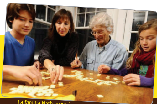
La familia Nathanson, inventores de BANANAGRAMS

Importado y Distribuido para España y Portugal por: Lúdilo S.L. Parque Empresarial Táctica. C/ Corretger, 127. 46980 - Paterna, Valencia (Spain).